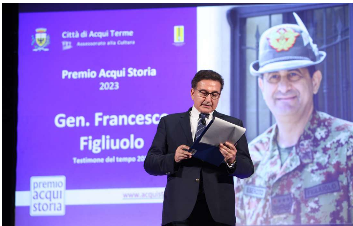
Gen. Francesco Figliuolo Testimone del Tempo 2023 presentato dal conduttore Roberto Giacobbo

Comandante Operativo di Vertice Interforze, Generale di Corpo d'Armata, il GENERALE FRANCESCO FIGLIUOLO ha maturato esperienze e ricoperto incarichi molteplici e diversificati, in ambito Forza Armata Esercito, interforze ed internazionale. Gli incarichi ricoperti nel suo percorso, gli hanno consentito di maturare esperienze in tutti gli ambiti della Forza Armata: nella formazione di base ed avanzata degli Ufficiali dell'Esercito presso la Scuola di Applicazione di Torino, nella pianificazione operativa in ambito NATO, presso il Joint Command South di Verona e nella logistica e nel procurement, ricoprendo l'incarico di Capo del IV Reparto Logistico presso lo Stato Maggiore dell'Esercito dall'agosto 2015 al maggio 2016. Di assoluto rilievo l'esperienza internazionale quale Rappresentante militare dell'Autorità nazionale e Comandante del contingente nazionale in Afghanistan, nell'ambito dell'operazione ISAF (ottobre 2004 - febbraio 2005) e quella di Comandante delle Forze NATO in Kosovo – COMKFOR 19 (settembre 2014 – agosto 2015).