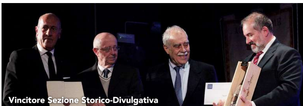
Vincitore Sezione Storico-Divulgativa