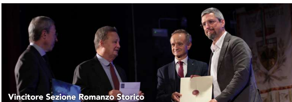
Vincitore Sezione Romanzo Storico