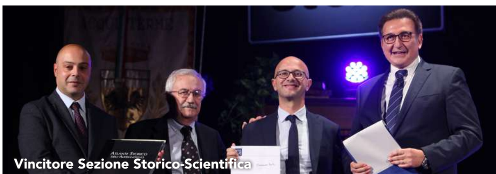
Vincitore Sezione Storico-Scientifica