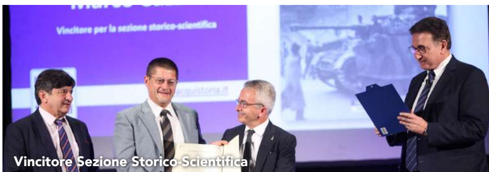
Vincitore Sezione Storico-Scientifica