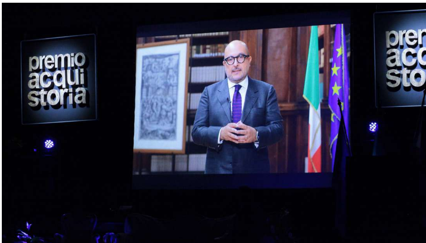
Saluto del Ministro alla Cultura On. Gennaro Sangiuliano al Premio Acqui Storia.