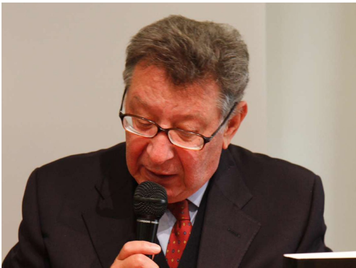
Francesco Perfetti Premio alla Carriera 2023

FRANCESCO PERFETTI riceve il Premio alla Carriera per l'impegno dedicato alla divulgazione storica e alla ricerca accademica. È stato professore ordinario di Storia contemporanea presso la Facoltà di Scienze politiche della Luiss Guido Carli di Roma, dove ha insegnato altresì Storia moderna.